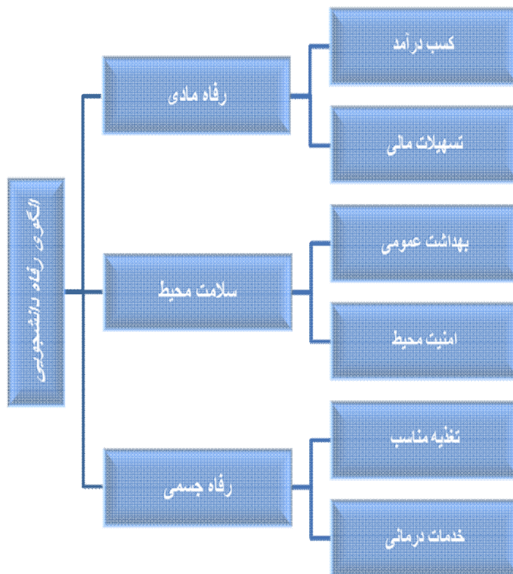
مدل رفاه دانشجویی