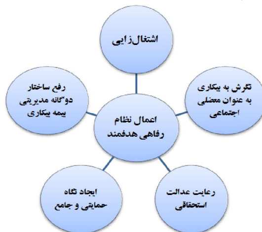
نمودار ۱- مفصل‌بندی گفتمان عدالت اجتماعی حاکم بر بیکاری در قانون بیمه بیکاری

ب) مفصل‌بندی گفتمان عدالت اجتماعی حاکم بر طرح بیمه بیکاری ایام