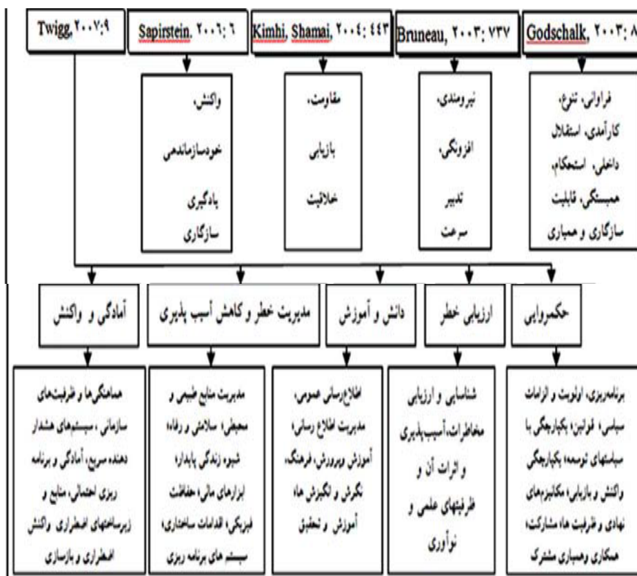
نمودار ۳- ویژگی‌های جوامع تاب‌آور (رفیعیان و همکاران، ۱۳۹۰: ۲۸)

وضعیت عادی دچار فروپاشی می‌شوند و قادر به سازگاری و پذیرش وضعیت جدید هم نیستند. وضعیت حاکم بر این جوامع با مفاهیمی مانند شکنندگی، حساسیت، ناتوانی در تغییر، آسیب‌پذیری، ضعف، انعطاف‌ناپذیری، عدم مقاومت، انحطاط، شکست و انفعال می‌توان تبیین کرد. در ارتباط با واکنش سیستم‌های تاب‌آور در برابر تنش‌ها و بحران‌ها، مطالعاتی به‌وسیله چالک (۲۰۰۳)، برنشو و همکارانش (۲۰۰۳)، کیم هی و شامای (۲۰۰۴)، ساپیر ستین (۲۰۰۶) و توینگ (۲۰۰۷) انجام شده است.