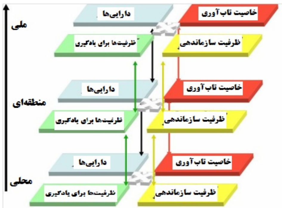
نمودار ۲- مؤلفه‌های تاب‌آوری اجتماعی در سطوح ملی، منطقه‌ای و محلی