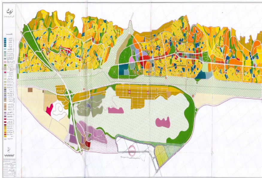
نقشه شماره ۱- کاربری اراضی شهر جدید صدرا